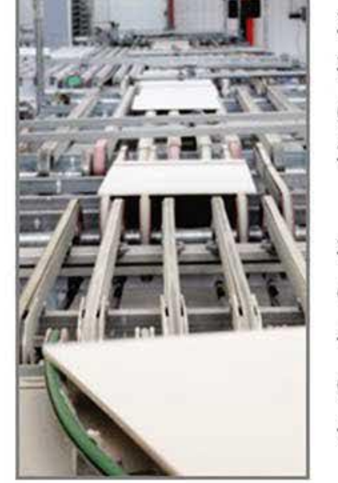
નોંધપાત્ર વધારો: એપ્રિલ ૨૦૨૬ ઉત્તરોત્તર વધારો જોવા દરમિયાન ઔદ્યોગિક પ્રવૃત્તિમાં મળ્યો છે. આંકડાકીય વિગતો મુજબ: કાર્યરત એકમોની સંખ્યા ૬૭૫ થી

૩૧ માર્ચ ૨૦૨૬: માત્ર ૮૩ ગ્રાહકો દ્વારા દૈનિક ૩.૬ લાખ ક્યુબિક મીટર ગેસનો વપરાશ થતો હતો. ૨૨ એપ્રિલ ૨૦૨૬: ગ્રાહકોની સંખ્યા વધીને ૨૯૦ થઈ છે અને દૈનિક વપરાશ ૨૭ લાખ ક્યુબિક મીટર સુધી પહોંચ્યો છે. આગામી અંદાજ: મે ૨૦૨૬ સુધીમાં ૭૦૦ સુધી પહોંચવાની શક્યતા છે, જેનાથી દૈનિક ગેસ વપરાશ ૬૦-૭૦ લાખ ક્યુબિક મીટર થઈ શકે છે. ગુજરાત ગેસની વ્યૂહરચના: ભૂ-રાજકીય સંકટ સમયે અવિરત પુરવઠો જાળવવા કંપનીએ મધ્ય પૂર્વ સિવાયના બજારોમાંથી બજાર લાવે ગેસની ખરીદી કરી ભારત સરકારના નિર્દેશોનું પાલન કર્યું છે. કંપનીએ વૈવિધ્યપૂર્ણ સોલિંગ વ્યૂહરચના અપનાવી મે ૨૦૨૬ માટે પણ સ્થિર ભાવ અને પુરવઠાની ખાતરી આપી છે. આ ઉપરાંત, ઉદ્યોગની